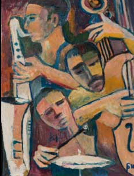
Siegfried Pfeuffer, jazzGAP 2012

vom Piano-Solo-Vortrag bis zur Bigband. Dies soll exemplarisch das gesamte Spektrum an Möglichkeiten vorführen, welches Jazz-Ensembles zur Verfügung steht. Die eingeladenen Gruppen sind stilistisch breit gefächert und wurden unter dem Gesichtspunkt größtmöglicher Vielfalt ausgesucht.